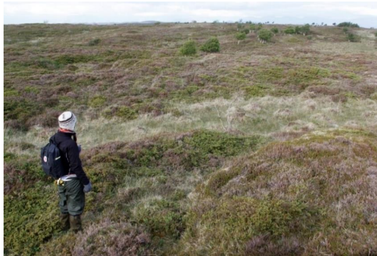
Risøya (rett nordøst for hovedøya Vega) har en mosaikk av tørr og fuktig lynghei.

og er det eldste kulturlandskapet vi har.