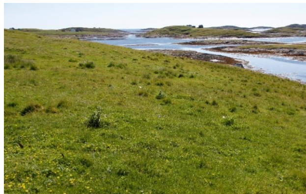
Slåttemark og naturbeitemark i Hysværet.