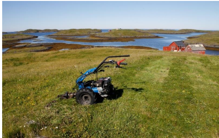
Slåttemark i Hysværet.