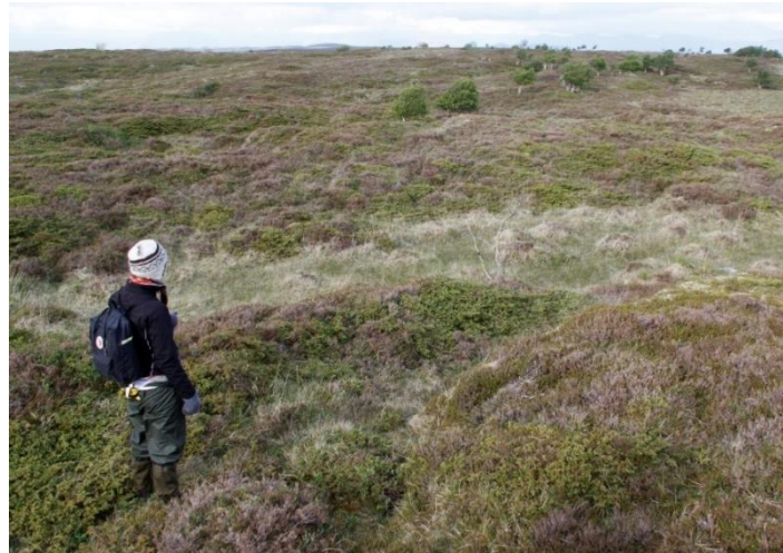
Risøya (rett nordøst for hovedøya Vega) har en mosaikk av tørr og fuktig lynghei.

Lyngheier forekommer ofte over store arealer og opptrer i mosaikk med andre naturtyper som myr og naturbeitemark.