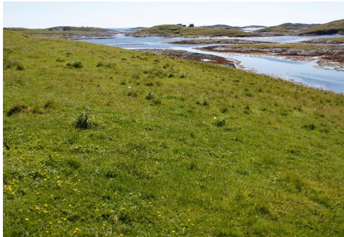
Naturbeitemark i Hysværet.

Artssammensetningen i naturbeitemark er preget av beiting, fordi dyr velger ut og beiter på de beste beiteplantene. Noen arter blir vraket på grunn av at de smaker dårlig, er giftige, stikkende eller seige. Beiting, særlig sauebeite, vil gi en mer gras- og mindre urtedominert plantebestand enn hva vi finner i slåttemark. Artene vil ha ujevn forekomst på beitearealet på grunn av ujevn fordeling av tråkk og husdyrgjødsel, og ujevn nedbeitingsgrad.