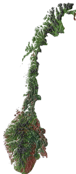
SR16 dekker alle skogområder i Norge.

SR16V med skogfigurer fungerer som oversiktskart på web eller til nedlastning for analyser der en trenger et vektorkart med figurering av skogen. Rasterkartet kan brukes direkte eller for å aggregere skoglige variabler til egendefinerte områder gjennom GIS-analyser.