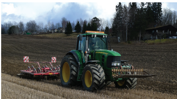
Figur 3. Vårharving gir betydelig lavere fosfortap enn høstpløying.

Sammenhengen mellom jordarbeiding og avrenning av løst fosfor er komplisert, og jordas fosforinnhold har også betydning. Ved overvintring i stubb er det også målt økte tap av løst fosfor i overflatevann. Utfrysing av fosfor fra planterester har bidratt til økningen. I 4 av 5 forsøk, uavhengig av erosjonsrisikoen, er det målt økte løst fosfor-konsentrasjoner i overflatevann ved overvintring i stubb. Kunnskap om betydningen av partikkelbundet versus løst fosfor for vannkvaliteten er avgjørende for vurderingen av disse forsøksresultatene.