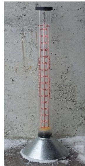
Vestfold frøavlerlag disponerer dette flowmeteret.

Etter rask nedtørking har frøet lett for å 'slå seg', dvs. ta opp nytt vann. Vi bør derfor kontrollere bingen på nytt et par dager etter nedtørking.