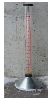
Bilde 5. Flowmeter.

Kaldlufttørke med kraftig vifte og store luftmengder passer best. For å kontrollere at en har en jevn luftgjennomstrømning alle steder i frømassen bør det benyttes et "flowmeter". Luftgjennomstrømningen bør være 6-7 m per