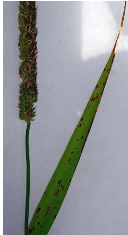
Soppsjukdommen timoteiøyeflekk på timoteiblade.

For å unngå resistensutvikling kan Proline benyttes maksimalt to ganger pr vekstsesong. Tidspunkt for bekjemping er ved begynnende angrep, vanligvis i perioden mellom begynnende strekningsvekst og blomstring. Ved tidlige angrep er det mulig å tankblande sopp- og vekstreguleringsmiddel (Cycocel 750, Moddus M, Moddus Start eller Trimaxx). Problemene med sopp dukker imidlertid gjerne opp fra blomstring og fram til høsting. Av den grunn er det vanskelig å bedømme behovet for sopp-sprøyting når enga er klar for første vekstregulering, og som regel vil det derfor lønne seg å vente med sprøyting til rundt skyting. Størst behov for sopp-sprøyting vil det være i regnfulle somre, spesielt i "kraftig" frøeng med høyt legdepress.