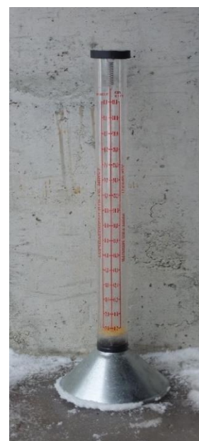
Bilde 2. Vestfold frøavlslag disponerer dette flowmeteret

Vanninnholdet i frøet vil hele tiden stå i likevekt med den relative fuktigheten i tørkelufta. Når vanninnholdet i frøet er kommet ned i ca 18% må vi derfor begynne å slå av vifta om natta, da luftfuktigheten er høyest. Seinere blir det aktuelle tidsrommet for tørking mindre og mindre, til sist bare noen timer midt på dagen. Frøet skal tørkes helt ned til 12% vann, tilsvarende en luftfuktighet på ca 50%. For å ta ut de siste prosentene kan det være aktuelt å sette forsiktig varme til tørkelufta slik at luftfuktigheten går ned. Men vi må være veldig forsiktig med oppvarming av lufta ved tørking av rått frø med over 30% vann.