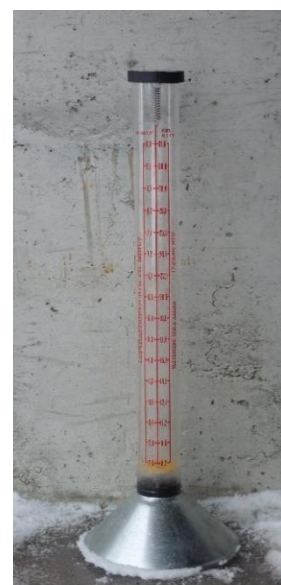
Bilde 2. Vestfold frøavlerlag disponerer dette flowmeteret

Vanninnholdet i frøet vil hele tiden stå i likevekt med den relative fuktigheten i tørkelufta. Når vanninnholdet i frøet er kommet ned i ca 18% må vi derfor begynne å slå av vifta om natta, da luftfuktigheten er høyest. Seinere blir det aktuelle tidsrommet for tørking mindre og mindre, til sist bare noen timer midt på dagen. Frøet skal tørkes helt ned til 12% vann, tilsvarende en luftfuktighet på ca 50%. For å ta ut de siste prosentene kan det være aktuelt å sette forsiktig varme til