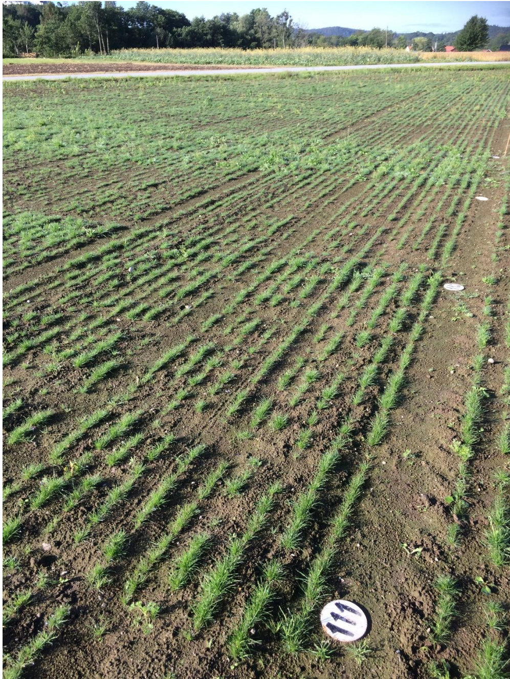
Bilde 1. Virkning av ulike doser Hussar Plus OD + Mero olje i gjenlegg til rødsvingelfrøeng på Landvik. Rute 111 (nærmest) hadde fått 5 ml/daa, og rute 112 (nr 2 fra kamera) 10 ml/daa. Rute 113 (nr 3 fra kamera) var usprøyta kontrollrute.

derimot opp i en dose på 10 ml/daa av Hussar Plus OD, er faren stor for å sette rødsvingelgjenlegget så mye tilbake at det går ut over neste års frøavling (bilde 1).