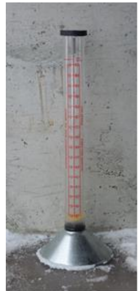
Bilde 2. Vestfold frøavlslag disponerer dette flowmeteret.

Rødsvingelkontraktene innebærer normalt tre høsteår, og forsøk har vist at riktig høstbehandling er viktig for å opprettholde avlingsnivået etter hvert som frøenga blir endre. Kutting eller brenning av frøhalmen hindrer danning av nye skudd som skal bli frøbærende året etter, og dert beste alternativet er derfor å fjerne halmen. Etter