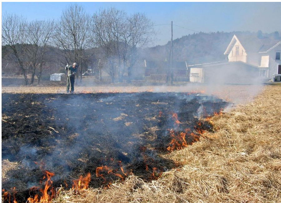
Brenning er en effektiv metode til å bli kvitt daugraset om våren i engsvingelfrøenga.

i frøhøstingsåret. Daugraset om våren kan enten brennes før vekststart eller det kan spres jevnt utover enga ved hjelp av en beitepusser/halmsnitter. For å unngå kjøreskader bør en foreta avpussingen mens det ennå er tele i jorda, eller vente til jorda har tørket noe. Vårbrenninga bør helst utføres når graset er tørt slik at røykutviklingen blir minst mulig. En strategi som er mye brukt er først å brenne ei stripe (om lag et par meter brei) langs alle kantene av enga, før resten av enga brennes, gjerne mot vindretningen.