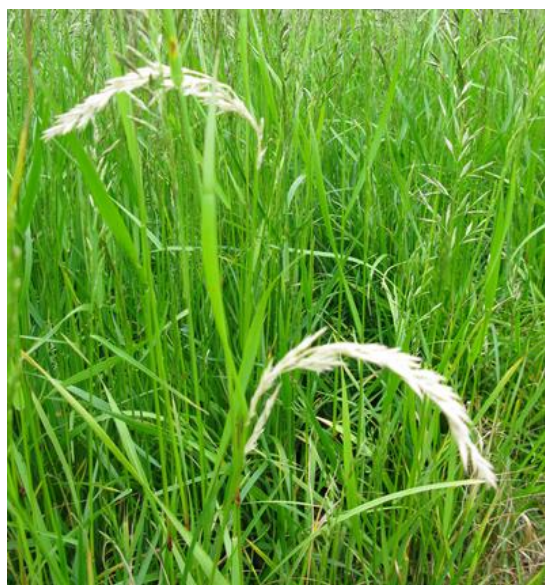
Kvitaksmidd kan særlig være problem i eldre frøeng.

Angrepene av skadeinsekter, spesielt kvitaksmidd , øker normalt utover i engåra. Spesielt stort behov for insektsprøyting vil det være hvis det i tidligere år har vært angrep i området. I forsøk i tredjeårseng har insektsprøyting hatt en klar positiv virkning på frøavlingen, også i de tilfeller hvor en ikke har observert synlige insektskader. Tredjeårs engsvingelfrøeng bør derfor sprøytes med pyretroid, f.eks. Karate 5 CS (15 ml/daa) ved begynnende strekningsvekst i slutten av mai. Denne sprøytinga kan med fordel kombineres med vekstregulering med Moddus (se under). I første- og andreårseng anbefales ikke rutinemessig insektsprøyting.