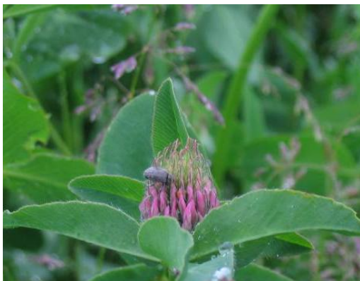
Bilde 2. Kløvergnager

Av rødkløversnutebiller fins det tre arter på Østlandet. Felles for dem er at det voksne individet er 1-2 mm langt og overvintrer i vegetasjonen rundt frøengene, spesielt i strøsjiktet i barskog. Når dagtemperaturen flere dager på rad kommer opp i ca 20°C, flyr de inn i frøenga og gnager tett i tett med små hull i bladene (næringsgnag eller hullgnag). Deretter legger de egg i blomsterknoppene. Eggene klekker til larver som gnager på frøanlegga, seinere frøene, inni belgene i hvert blomsterhode. På ettersommeren forpupper larvene seg, og etter klekking kan de voksne individene igjen foreta næringsgnag på bladene før de flyr til overvintringsstedene rundt frøenga.