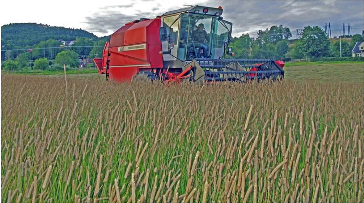
Direkte tresking av timoteifrøeng.

Det bør stubbes høyt ved første tresking hvis mulig. Hvor mange dager det skal gå mellom treskingene avhenger av været. Med tørt og varmt vær er det neppe grunn til å vente mer enn 3-4 dager. Ved siste tresking tåler frøet noe hardere tresking. Det er store variasjoner i fordeling av avlinga ved første og andre tresking. Normalt tas ca. 2/3 ved første tresking.