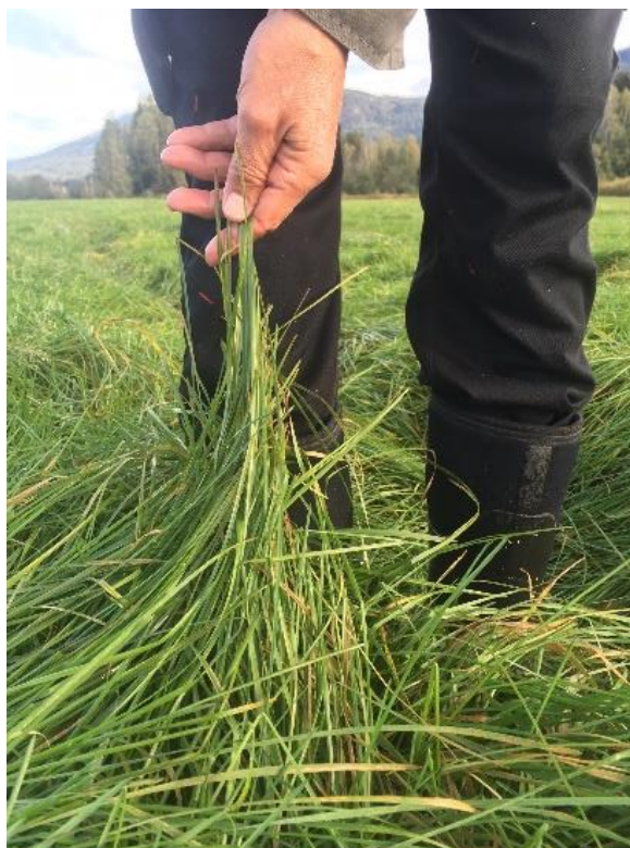
Bilde 3. Svært bladrikt gjenlegg av 'Knut' engrapp i midten av september 2019. Så bladrike gjenlegg bør avpusses og det avpussa materialet fjernes.

Behovet for avpussing om høsten av engrappgjenlegg etablert uten dekkvekst avhenger av hvor tidlig det er sådd og i hvor stor grad veksten er satt tilbake av en eller flere gangers ugrassprøyting, spesielt med Hussar Plus OD. Avpussing allerede i august frarådes da det vil redusere oppbygginga av karbohydrat-reserver i de unge plantene og slippe lys ned til bakken slik vi får mer spiring av tunrapp og andre grasugas. Om engrappen ikke er høyere enn 20-25 cm i midten av september er det heller ikke nødvendig å pusse. Svært bladrike gjenlegget som vist i bilde 2 (30-50 cm høye planter når bladene dras opp), bør derimot avpusses til 5-10 cm) og det avpussa materialet fjernes innen høstgjødsling ca 1.oktober.