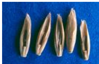
Bilde 1. Frø av engrapp.

Nest etter engkvein har engrapp det minste frøet av grasartene som frøavles i Norge. Tusenfrøvekta er om lag 0,35 g. Frøet er gulbrunt i farge, langstrakt og trekanta i tverrsnitt. Ullaktig behåring på inneragnene gjør at engrappfrøet lett loer seg sammen under treskinga.