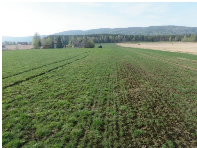
Bilde 2. Hussar-sprøyting i første års frøeng av engrapp.