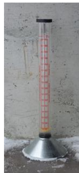
Bilde 2. Vestfold frøavlerlag disponerer dette flowmeteret.

Vanninnholdet i frøet vil hele tiden stå i likevekt med den relative fuktigheten i tørkelufta. Når vanninnholdet i frøet er kommet ned i ca 18% må vi derfor begynne å slå av vifta om natta, da luftfuktigheten er høyest. Seinere blir det aktuelle tidsrommet for tørking mindre og mindre, til sist bare noen timer midt på dagen. Frøet skal tørkes helt ned til