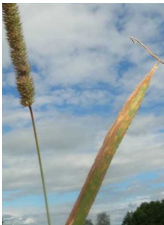
Timoteiblad angrepet av soppssjukdommen timoteibrunflekk.

Mot soppssjukdommer i timoteifrøeng har medlemmer av Norsk frøavlerlag off-label godkjenning for sprøyting med Proline i dosen 40 - 80 ml/daa.