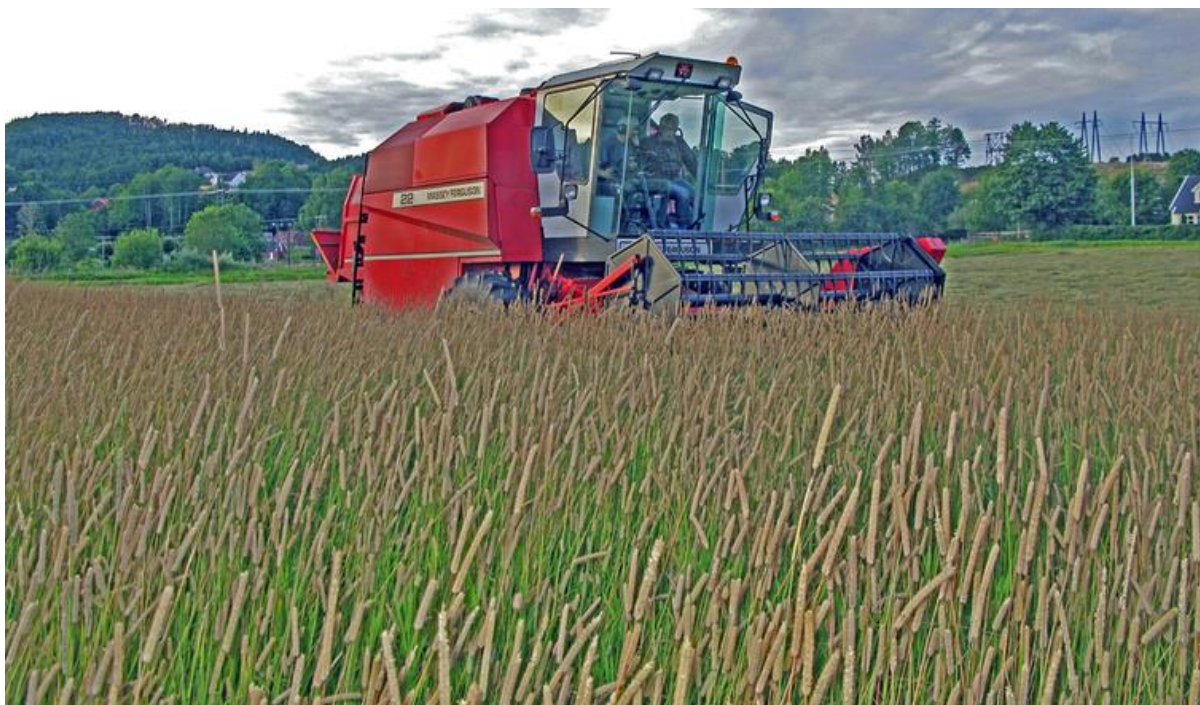
Direkte tresking av timoteifrøeng.

Det bør stubbes høyt ved første tresking hvis mulig. Hvor mange dager det skal gå mellom treskingene avhenger av været. Med tørt og varmt vær er det neppe grunn til å vente mer enn 3-4 dager. Ved siste tresking tåler frøet noe hardere tresking. Det er store variasjoner i fordeling av avlinga ved første og andre tresking. Normalt tas ca. 2/3 ved første tresking.