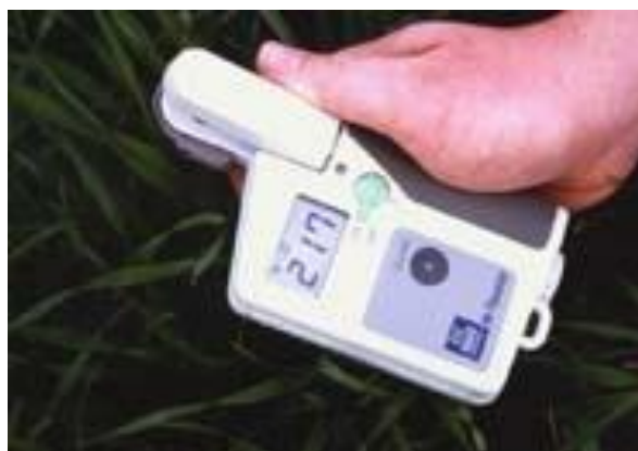
Yara N-Tester kan brukes som hjelpemiddel i 'Grindstad' timotei til å vurdere behovet for nitrogen ved delgjødsling i midten av mai (ved beg. strekningsvekst).

YNT- målingene utføres midt på plantenes sist fullt utvikla blad ved begynnende strekningsvekst, på et representativt utvalg av planter i frøenga (30 målinger pr YNT-verdi). Ved å følge modellen gir en YNT-verdi på 300, 350 og 400 en anbefalt delgjødslings-mengde på henholdsvis 5.0, 3.1 og 1.5 kg N/daa. Forsøksringene i frøavlsdistriktene har Yara N-tester, og er behjelpelige med videre veiledning. Måleapparatet kan også leies fra Yara.