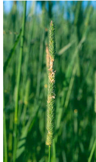
Skade av timoteiflua.

Dersom vi ved grundig kontroll finner egg på mer enn 5 % av stråene, er det aktuelt å sprøyte. Bruk et pyretroidmiddel, f.eks. Fastac 50 (30 ml/daa), Karate 5CS (15 ml/daa) eller Decis (12,5 ml/daa). Karate 5 CS er mest aktuelle hvis det også skal sprøytes mot kvitaksmidd. Fastac er under avvikling og har siste bruksdato 30. juni 2019.