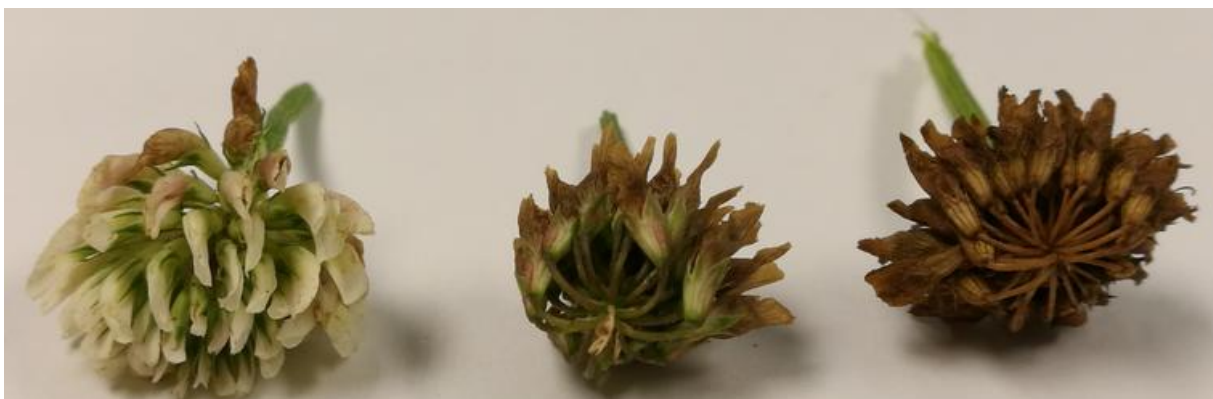
Bilde 1. Blomsterhode i full blomst (til venstre), samt nedvisna frøhoder, vurdert som enten umodent med grønne småstilk (midten) eller som modent med inntørka, brune småstilk (til høyre).

Når kvitkløverfrøenga går mot modning, blir blomsterhodene brune og åpne i toppen. Frøet er ikke modent før blomsterstengelen er inntørka og de små stilkene som fester belgene til aksspindelen visner slik at belgene kan rispes av mellom fingrene (helt til høyre på bilde 1).