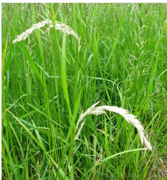
Kvitaksmidd kan særlig være problem i eldre frøeng.

Angrepene av skadeinsekter, spesielt kvitaksmidd , øker normalt utover i engåra. Spesielt stort behov for insektsprøyting vil det være hvis det i tidligere år har vært angrep i området. I forsøk i tredjeårseng har insektsprøyting hatt en klar positiv virkning på frøavlingen , også i de tilfeller hvor en ikke har observert synlige insektskader. Tredjeårs engsvingelfrøeng bør derfor sprøytes med pyretroid, f.eks. Karate 5 CS (15 ml/daa) eller Decis (12,5 ml/daa) ved begynnende strekningsvekst i slutten av mai. Denne sprøytinga kan med fordel kombineres med vekstregulering med Moddus (se under). I eldre forsøk (1995-1996) har det ikke vært noen avlingsgevinst å hente ved å sprøyte frøenga med pyretroid mer enn en gang pr sesong. I første- og andreårseng anbefales ikke rutinemessig insektsprøyting.