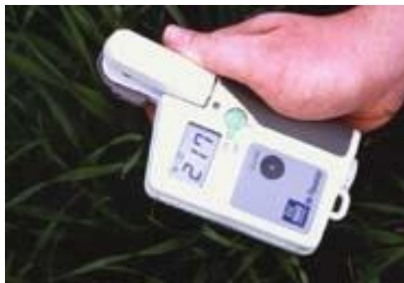
Yara N-Tester kan brukes som hjelpemiddel i 'Grindstad' timotei til å vurdere behovet for nitrogen ved delgjødsling i midten av mai (ved beg. strekningsvekst).

YNT- målingene utføres midt på plantenes sist fullt utvikla blad ved begynnende strekningsvekst, på et representativt utvalg av planter i frøenga (30 målinger pr YNT-verdi). Ved å følge modellen gir en YNT-verdi på 300, 350 og 400 en anbefalt delgjødslings-mengde på henholdsvis 5.0, 3.1 og 1.5 kg N/daa. Forsøksringene i frøavlsdistriktene har Yara N-tester, og er behjelpelige med videre veiledning. Måleapparatet kan også leies fra Yara.