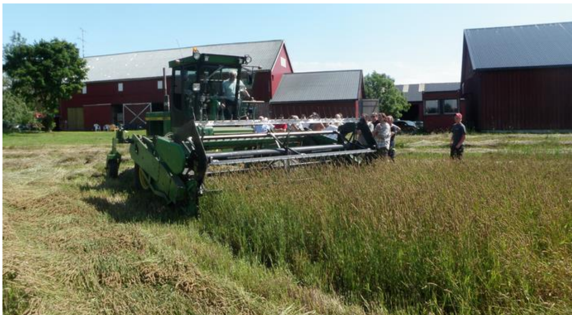
Skårlegging av timoteifrøeng.

frøavlingene berget på ruter som var høstet på tradisjonell måte med direkte skurtresking i to omganger. Skårlegging før tresking, enten tidlig (40-45 % vann i frøet) eller seint (30-35 % vann i frøet) reduserte avlingsnivået med henholdsvis 6 og 13 %.