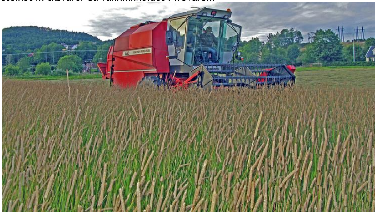
Direkte tresking av timoteifrøeng.

Anbefalt høstestrategi har helt siden 1960-tallet vært å treske timoteifrøenga to ganger. Første gangs tresking gjøres når frøene begynner å slippe og det er antydning til dryssing helt øverst i akset. Mest sikkert er det å prøvetreske og se hva som kommer i tanken og hvor mye som ligger igjen i loa. Fargen på frøene i tanken bør være mer gul enn grønn, og vanninnholdet bør ikke være over 35%. Vanninnholdet kan enkelt bestemmes ved å veie inn 100 g i en metallskål (fjern mest mulig av stubb og agner først). Vekttapet etter en times tørking ved 130 °C i steikeovn tilsvarer da vanninnholdet i frøvaren.