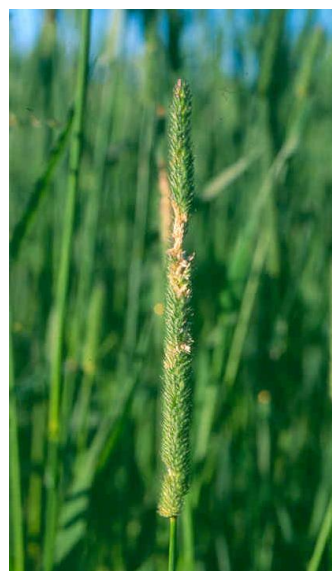
Skade av timoteiflua.

Dersom vi ved grundig kontroll finner egg på mer enn 5 % av stråene, er det aktuelt å sprøyte. Bruk et pyretroidmiddel, f.eks. Karate 5CS (15 ml/daa) eller Decis (12,5 ml/daa). Karate 5 CS er mest aktuelle hvis det også skal sprøytes mot kvitaksmidd.