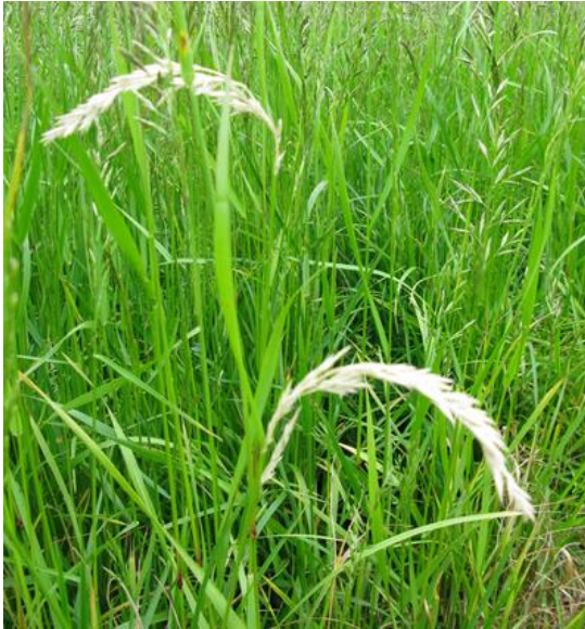
Kvitaksmidd kan særlig være problem i eldre frøeng.

Bladminerflue angriper alle kornarter og mange grasarter, deriblant engsvingel, men er som oftest lite avlingsreducerende. I noen år kan imidlertid frøavlingen bli redusert, spesielt hvis flaggbladet blir sterkt angrepet, og sprøyting er nødvendig. Det anbefales å sprøyte like før flaggbladet kommer til syne dersom det er mer enn 1 / 3 minert bladareal på de nedre bladene, og det samtidig er næringsstikk på de øvre bladene (dvs. at angrepet fortsatt er under utvikling). Det kan brukes pyretroid (Decis eller Karate).