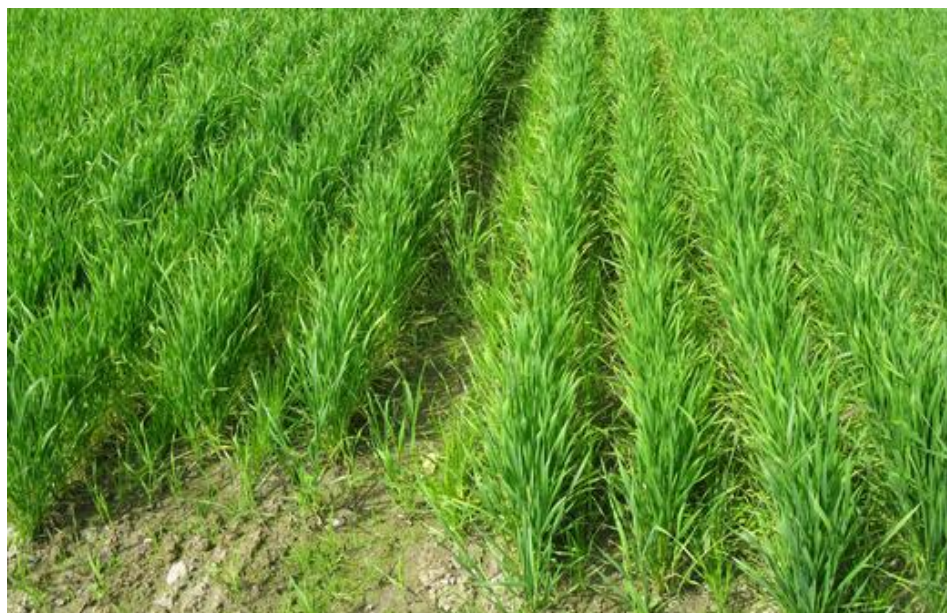
Etablering av engsvingel sådd i annenhver sålabb med Bjarne vårhete som dekkvekst.

Dersom en har mulighet for det, er det en god etableringsmetode å så dekkvekst og engsvingel i annenhver labb. I økologiske frøavlsforsøk gav denne metoden 20 % større frøavling i første engår sammenlikna med kryssåing i to arbeidsoperasjoner, og dette var klart økonomisk lønnsomt til tross for redusert kornavling i gjenleggsåret. På grunn av bedre tilgang på lettløselig nitrogen er det rimelig å tro at avlingsutslaga både for korn og frø vil være mindre, men at metoden likevel vil være lønnsom også ved konvensjonell frøavl.