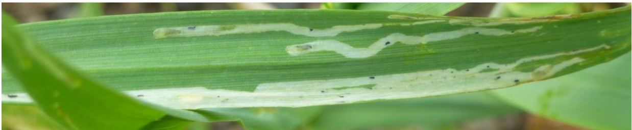
Bladminerflue kan enkelte år gjøre stor skade.

Bladminerflue angriper alle kornarter og mange grasarter, deriblant engsvingel, men er som oftest lite avlingsreducerende. I noen år kan imidlertid frøavlingen bli redusert, spesielt hvis flaggbladet blir sterkt angrepet, og sprøyting er nødvendig. Det anbefales å sprøyte like før flaggbladet kommer til syne dersom det er mer enn 1 / 3 minert bladareal på de nedre bladene, og det samtidig er næringsstikk på de øvre bladene (dvs. at angrepet fortsatt er under utvikling). Det kan brukes pyretroid (Decis eller Karate).