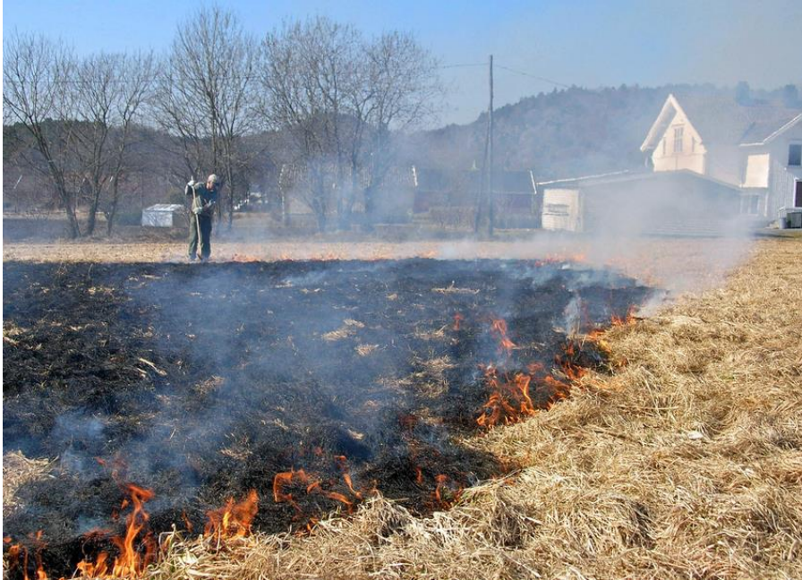
Brenning er en effektiv metode til å bli kvitt daugraset om våren i engsvingelfrøenga.

I områder hvor snødekket er mer stabilt (innlandsområdene nord for Oslo) har avpussing om høsten mindre betydning. I slike områder kan gjenveksten om høsten utnyttes til fôr uten at det går nevneverdig ut over overvintringsevnen og frøavlingen året etter. Benyttes en slik strategi anbefales det at en gjødsler enga med 5-6 kg N/daa like etter frøhøsting og tar fôrslåtten i begynnelsen av september. Seinere slått om høsten gir høyere tørrstoffavling men kvaliteten på fôret blir dårligere.