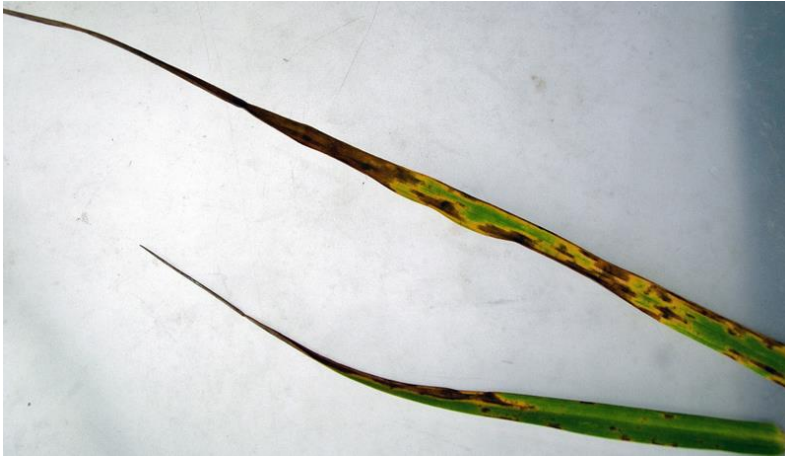
Blad av engsvingel angrepet av engsvingelbrunflekk.

Mot soppjukdommer i engsvingelfrøeng har medlemmer av Norsk frøavlerlag off-label godkjenning for sprøyting med Proline i dosen 40 - 80 ml/daa.