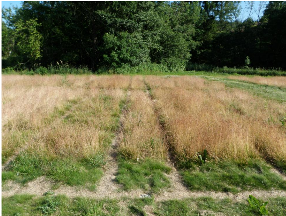
Bilde 2. Riktig høstbehandling er viktig ved frøavl av sauesvingel. På ruta til venstre var halmen tilbakeført og ruta ble ikke avpussa om ettersommeren / høsten. På ruta til høyre ble halmen fjerna og stubben avpussa etter tresking. (Feltet i midten er grense mellom høsterutene).

Sauesvingel har lite rotsystem, og frøenga bør derfor ikke brennes, verken høst eller vår.