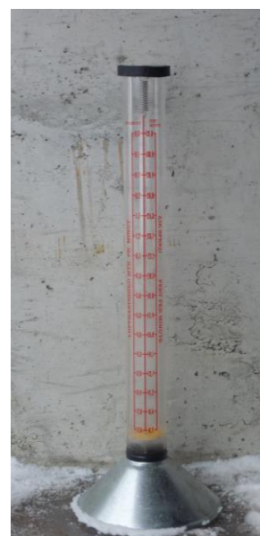
Bilde 1. Flowmeter

Vanninnholdet i frøet vil hele tiden stå i likevekt med den relative fuktigheten i tørkelufta. Når vanninnholdet i frøet er kommet ned i ca 18 %, må vi derfor begynne å slå av vifta om natta, da luftfuktigheten er høyest. Seinere blir det aktuelle tidsrommet for tørking mindre og mindre, til sist bare noen timer