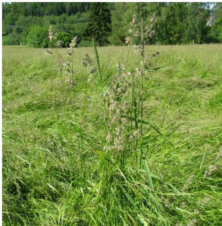
Hundegras kan være vanskelig å rense fra engsvingel frøet og bør lukes bort før høsting.

Kveka må bekjempes med planmessig bruk av glyfosat i åra før gjenlegg. Dersom en er redd for at det fortsatt er kveke igjen på arealet i gjenleggsåret, vil det beste være å så engsvingelen uten dekkvekst. Kveka bør da vokse uforstyrret fra våren av, og så sprøytes med glyfosat ca 1 uke før jordarbeiding og såing av engsvingelen.