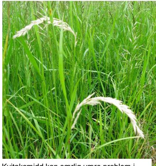
Kvitaksmidd kan særlig være problem i eldre frøeng.

Angrepene av skadeinsekter, spesielt kvitaksmidd , øker normalt utover i engåra. Spesielt stort behov for insektsprøyting vil det være hvis det i tidligere år har vært angrep i området. I forsøk i tredjeårseng har insektsprøyting hatt en klar positiv virkning på frøavlingen, også i de tilfeller hvor en ikke har observert synlige insektskader. Tredjeårs engsvingelfrøeng bør derfor sprøytes med pyretroid, f.eks. Karate 5 CS (15 ml/daa) ved begynnende strekningsvekst i slutten av mai. Denne sprøytinga kan med fordel kombineres med vekstregulering med Moddus (se under). I første- og andreårseng anbefales ikke rutinemessig insektsprøyting.