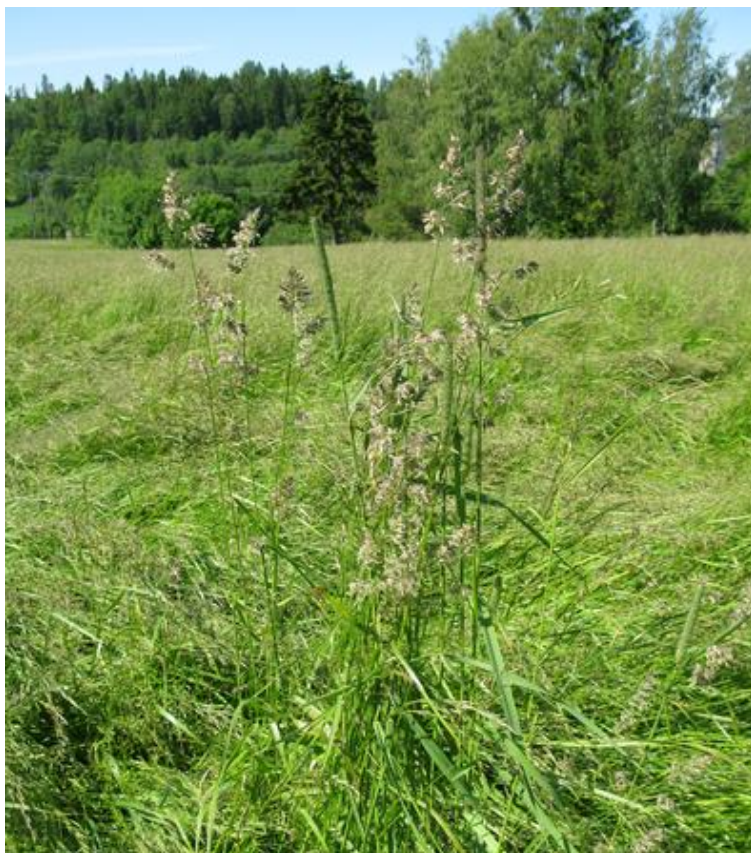
Hundegrass kan være vanskelig å rense fra engsvingelfrøet og bør lukes bort før høsting.

Kveka må bekjempes med planmessig bruk av glyfosat i åra før gjenlegg. Dersom en er redd for at det fortsatt er kveke igjen på arealet i gjenleggsåret, vil det beste være å så engsvingelen uten dekkvekst. Kveka bør da vokse uforstyrret fra våren av, og så sprøytes med glyfosat ca 1 uke før jordarbeiding og såing av engsvingelen.