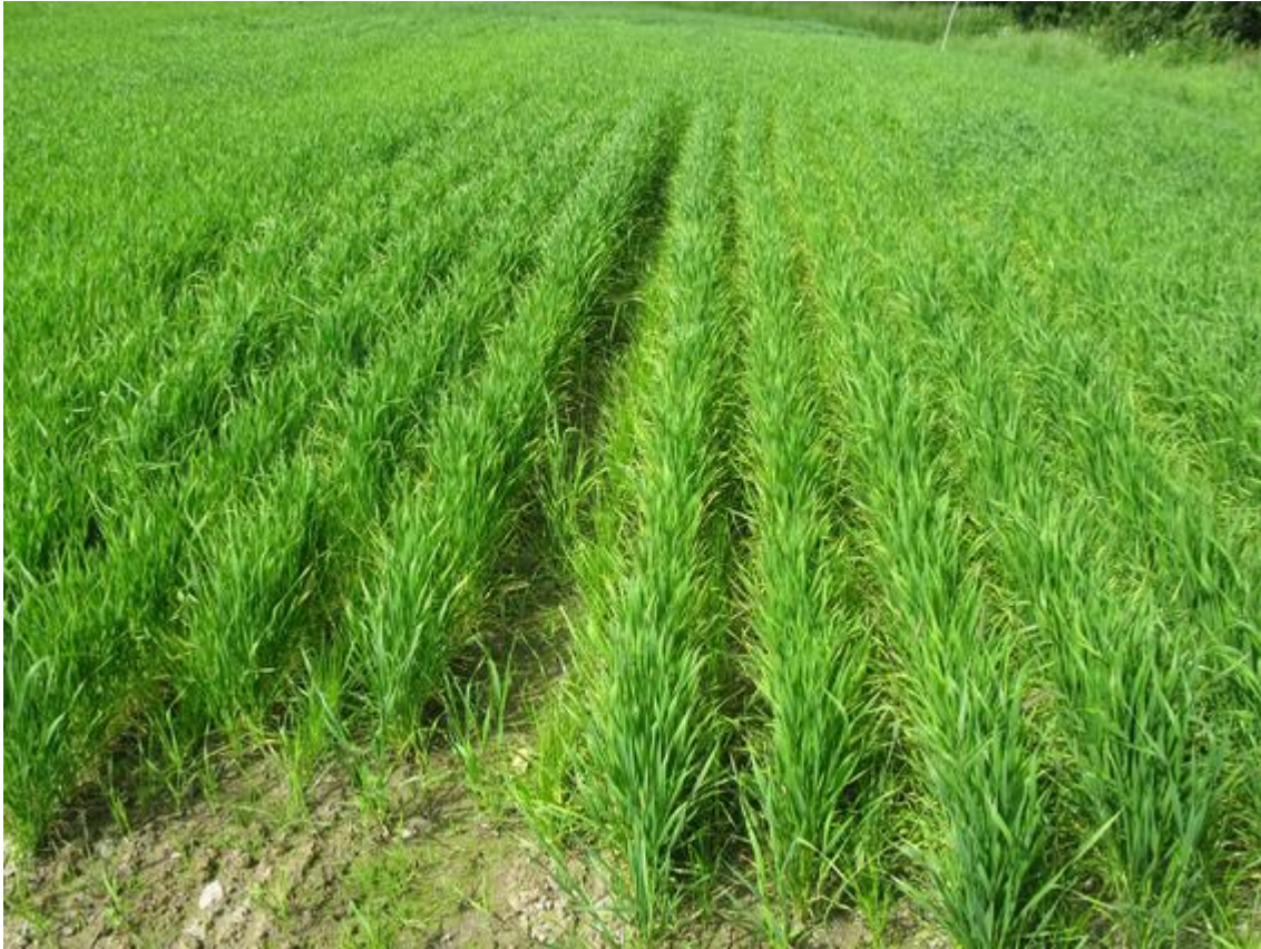
Etablering av engsvingel sådd i annenhver sålabb med Bjarne vårhvete som dekkvekst.