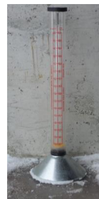
Bilde 5. Flowmeter.

http://www.svenskraps.se/kunskap/pdf/00764.pdf