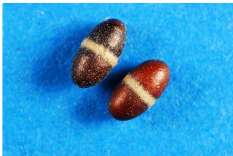
Bilde 3. Kokonger med karakterisk hvitt magebelte (pupper av kløvergnager parasittert av snylteveps).

slik at sideskudd visner og rødkløverplantene ikke forgreiner seg på vanlig måte. Vanligvis antar vi derfor at en larve av kløvergnager gjør like stor skade som ti larver av rødkløversnutebille. Innflyginga av kløvergnager i frøenga skjer vanligvis noe tidligere, over et lengre tidsrom og er ikke så temperaturavhengig som innflyginga av rødkløversnutebiller. De siste åra har det vært observert en del kokonger (pupper parasittert av snylteveps) av kløvergnager ved rensing av norske rødkløverpartier, og noen frøavlere har funnet det voksne skadedyret på frøtørka. Alt i alt antar vi derfor at kløvergnager gjør større skade enn rødkløversnutebillene i frøavlsdistriktene sør for Oslo. Forekomsten er likevel nokså sporadisk, med flest funn hos bestemte frøavlere i Østfold og Telemark. I Hedmark har det så langt ikke vært funnet kløvergnager.