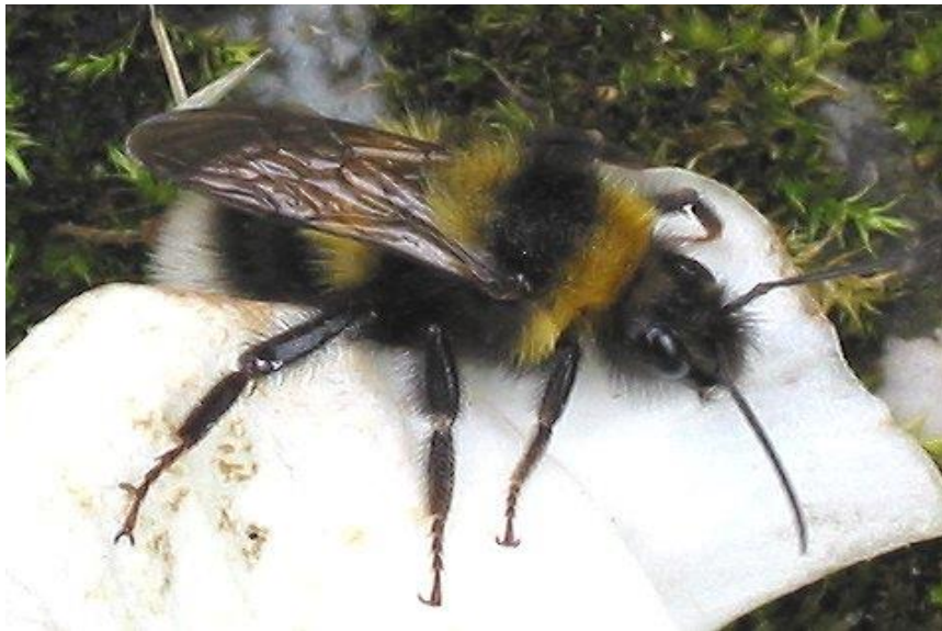
Bilde 1. Hagehumla har lang tunge og er effektiv til å pollinere rødkløver. Den trives også på andre erteplanter som blomkarse, sibirertebusk, gullregn og åkerbønne.

Av humler er det bare de befruktede dronningene som overvintrer. Allerede i slutten av august graver dronninga seg ned i et overvintringskammer i jordvoller og nordvendte skråninger rundt frøenga, men også i vanlig åkerjord. Når temperaturen stiger om våren, vil dronningene fly ut og forsyne seg med pollen fra hannplanter av selje ('gåsunger'). Deretter vil de bygge bol i gammelt gras og planteavfall langs veikanter, grøfter og lignende. Gamle musebol og ganger etter jordrotter isolerer godt og er spesielt populære. For å øke forekomsten av humler må vi unngå å ødelegge eller brenne disse områdene rundt frøenga, og vi kan gjerne legge ut gamle halmballer, grasavklipp eller annet planteavfall. Vi kan også hjelpe dronningene med å finne bolplasser ved å bygge humlekasser eller legge gamle musebol eller tørt, mykt gress i blomsterpottene som settes ut opp-ned på et beskyttet sted slik at grevling eller andre dyr ikke forstyrre pottene. Hagehumla bygger bol i jorda, så da kan vi det være nok å grave små huller i en skråning / jordvoll og legge plankebiter eller steiner over, det må også legges byggematerialer for humla i hulrommet. Uansett er det avgjørende at det er tørt på bolplassen.