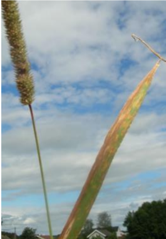
Timoteiblade angrepet av soppsjukdommen timoteibrunflekk.