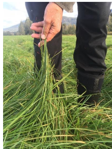
Bilde 2. Svært bladrikt gjenlegg av 'Knut' engrapp i midten av september 2019. Så bladrike gjenlegg bør avpusses og det avpussa materialet fjernes.

Behovet for avpussing om høsten av engrappgjenlegg etablert uten dekkvekst avhenger av hvor tidlig det er sådd og i hvor stor grad veksten er satt tilbake av en eller flere gangers ugrassprøyting, spesielt med Hussar OD eller Hussar Plus OD. Avpussing allerede i august frarådes da det vil redusere oppbygginga av karbohydratreserver i de unge plantene og slippe lys ned til bakken slik vi får mer spiring av tunrapp og andre grasugas. Om engrappen ikke er høyere enn 20-25 cm i midten av september er det heller ikke nødvendig å pusse. Svært bladrike gjenlegget som vist i bilde 2 (30-50 cm høye planter når bladene dras opp), bør derimot avpusses til 5-10 cm) og det avpussa materialet fjernes innen høstgjødsling ca 1.oktober.