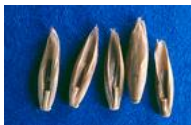
Bilde 1. Frø av engrapp.

Nest etter engkvein har engrapp det minste frøet av grasartene som frøavles i Norge. Tusenfrøvekta er om lag 0,35 g. Frøet er gulbrunt i farge, langstrakt og trekanta i tverrsnitt. Ullaktig behåring på inneragnene gjør at engrappfrøet lett loer seg sammen under treskinga.