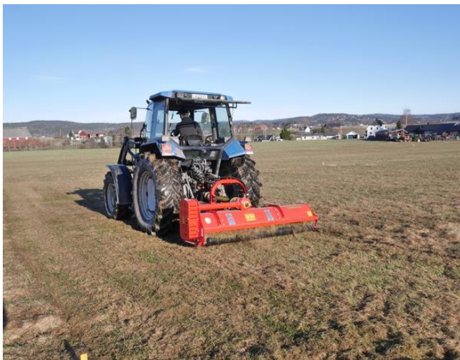
Bilde 3. Vårpussing av tredjeårs engrappfrøeng med mye daugras, Vestfold 25.april 2018.

I utlandet er det vanlig å brenne frøhalm og stubb i engrappfrøengene om ettersommeren / høsten. I Norge har de fleste engrappfrøenger så mye grønnmasse at det er vanskelig å få til en god og jamn avbrenning. I stedet anbefaler vi at frøhalmen fjernes like etter tresking, og at stubb- og gjenvekst deretter avpusses i løpet av august. Det avpussa materialet bør helst fjernes fra enga, men det er bedre å pusse og spre stubb og gjenvekst enn å ikke foreta noen avpussing overhodet.