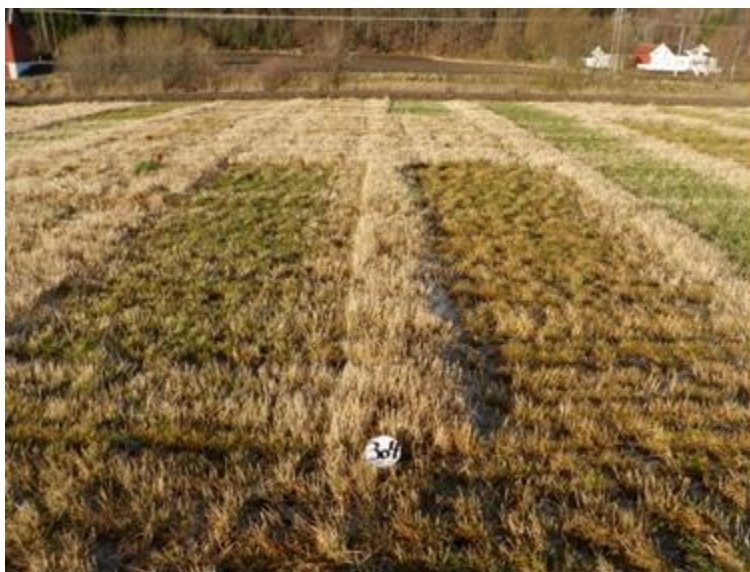
Bilde 4. Frøeng av engkvein bør gå vinteren i møte som ruta til venstre. Denne ruta var avpussa 1.sept. og høstgjødsla 24.sept. Også ruta til høyre, som var både avpussa og gjødsla 1.sept., gav klart større frøavling enn de upussa rutene i bakgrunnen. Foto tatt 1.des. 2014 av Trygve S. Aamlid.

I middel for perioden 2019-2023 var gjennomsnittsfrøavlinga av både 'Leikvin' og 'Leirin' 16 kg/daa. Erfarne frøavlere har høyere gjennomsnitt, og for 'Leikvin' har enkelte oppnådd over 50 kg/daa på større areal. Etter prisforhandlingene i juni 2025 er oppgjørspriisen 190 kr/kg for begge sorter. Dette forutsetter normalkvalitet, dvs. 12% vann og 90% spiring. Mattilsynets minimumskrav for sertifisering av kveinfrø er 75% spiring, 90% renhet og maksimum 2% ugrasfrø, derav maksimum 1% av en enkelt art.