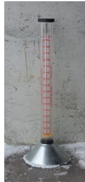
Bilde 3. Vestfold frøavlerlag disponerer dette flowmeteret.

Nyere forsøk i 'Leikvin' (2013-2017) viste at stående stubb på 10 cm eller høyere, samt lang nedkjørt stubb bør pusses til 5 cm etter tresking og halmfjerning i slutten av august. I middel for fire forsøk på Landvik gav pussing 13 % større frøavling året etter dersom pussinga ble utført like etter tresking sist i august, og 7 % større frøavling dersom pussinga ble utsatt til siste uke av september. Ved pussing like etter tresking / halmfjerning ble neste års frøavling større om det avpussa materialet ble finfordelt og jamt spredt i enga enn om det ble fjerna, og ved utsatt pussing hadde det heller ingen negativ betydning om det avpussa materialet fikk ligge igjen i frøenga. Et viktig resultat i disse forsøka var at avpussing om høsten gav mindre og seinere legde året etter.