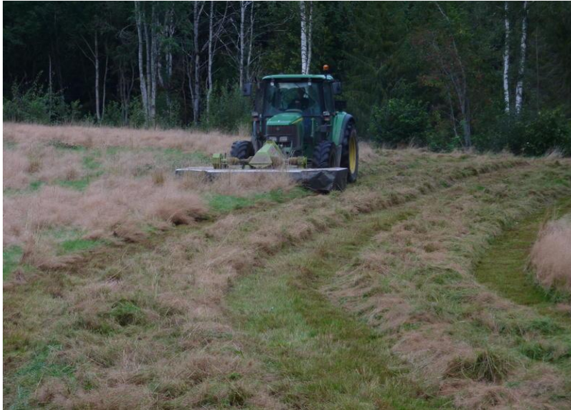
Bilde 2. Skårlegging av engkvein.