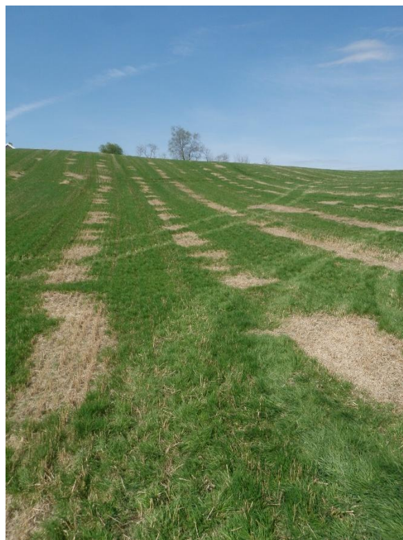
Bilde 1. I denne førsteårsenga av 'Leirin' hadde dekkveksthalmen blitt liggende litt for lenge.

Med disse nye sortene er behovet for å redusere såmengde og gjødsling mindre enn ved gjenlegg i eldre kornsorter, men det er uansett viktig at gjenleggsåkeren ikke går i legde. Vi anbefaler derfor en såmengde på 15 kg/daa av toradsbygg og 20 kg/ daa av vårhvete. Gjødsling til hveten kan være som ved dyrking uten gjenlegg (delgjødsling er bra for gjenlegget), mens vårgjødsling til bygg bør reduseres med 20% for å unngå for kraftig busking. Ved tresking er det viktig å sette igjen kort stubb og unngå spillkorn. Ved tresking av hvete bør treskeren ha agnespreder slik at agnene ikke blir liggende i et tykt lag på et mindre areal. Dekkveksthalmen skal fjernes like etter tresking (bilde 1).