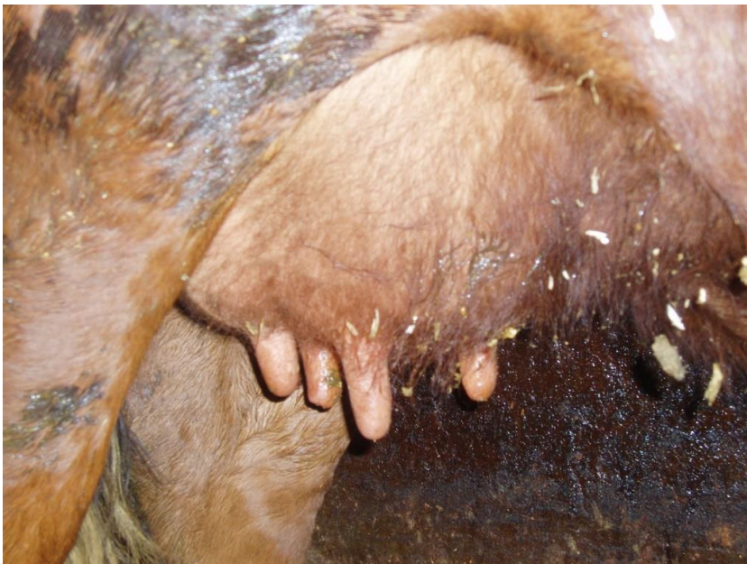
Figur 4 Jur fra siden mor Staslin 0302