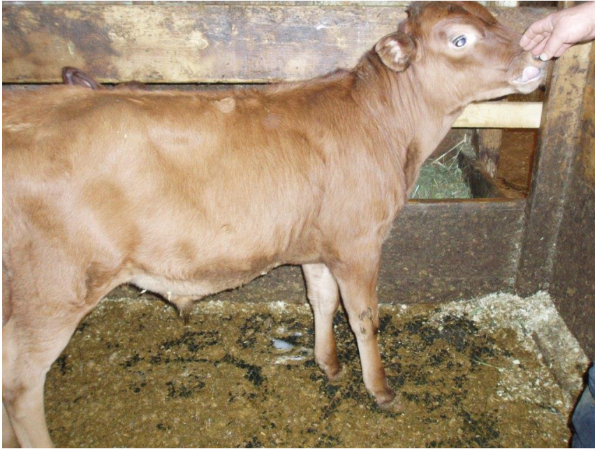
Figur 1 Morgan av Ruud ØR-seminokseforslag