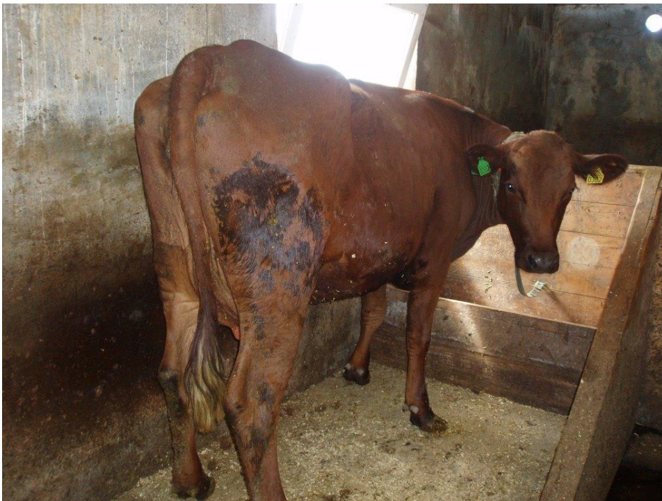
Figur 2 0302 Staslin, mor til Morgan av Ruud ØR