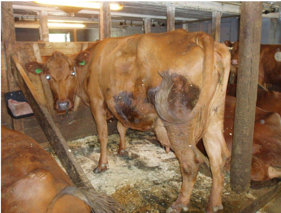
Figur 2 Mor til Kvikk av Ruud