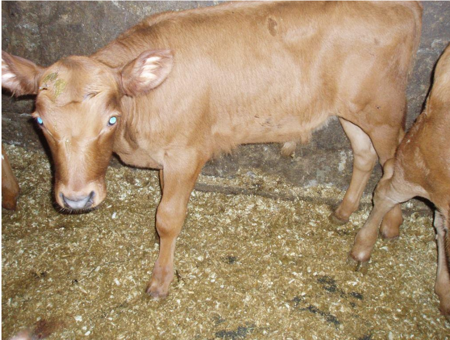
Figur 1 Kvikk av Ruud