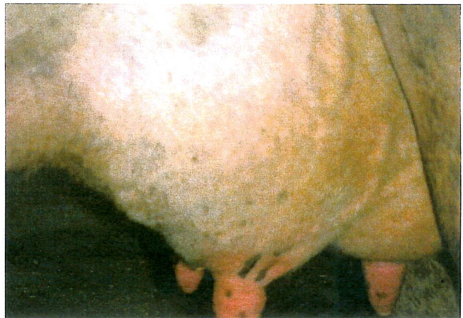
2/5 Bostad linn