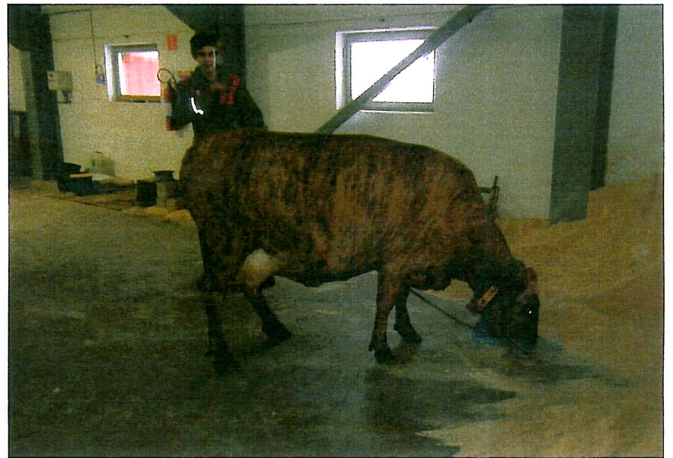
.215 Bostalin 1 premie pa° Seljord 2008