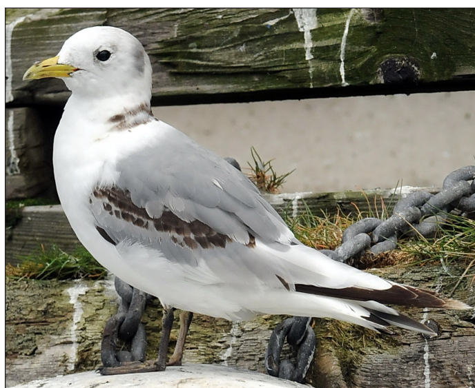
Noen krykkjer har svart på vingene og i nakken. Disse fuglene kalles noen steder i Finnmark for «Spitsbergkrykkje». Dette er unge krykkjer. Når de blir to år gamle har de en sammenhengende lys grå vinge.