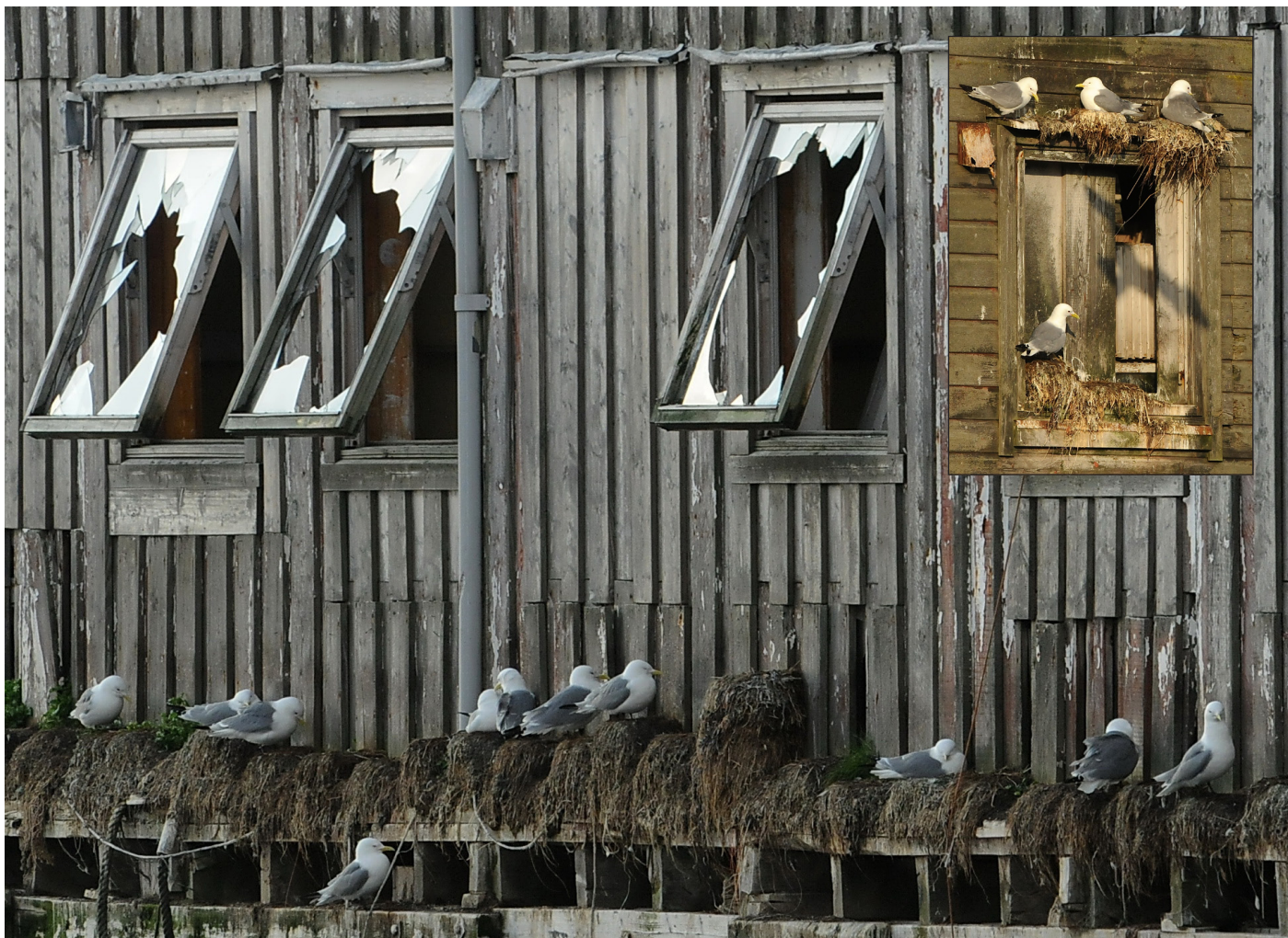
Krykkjene hekker på forlatte hus i Vardø