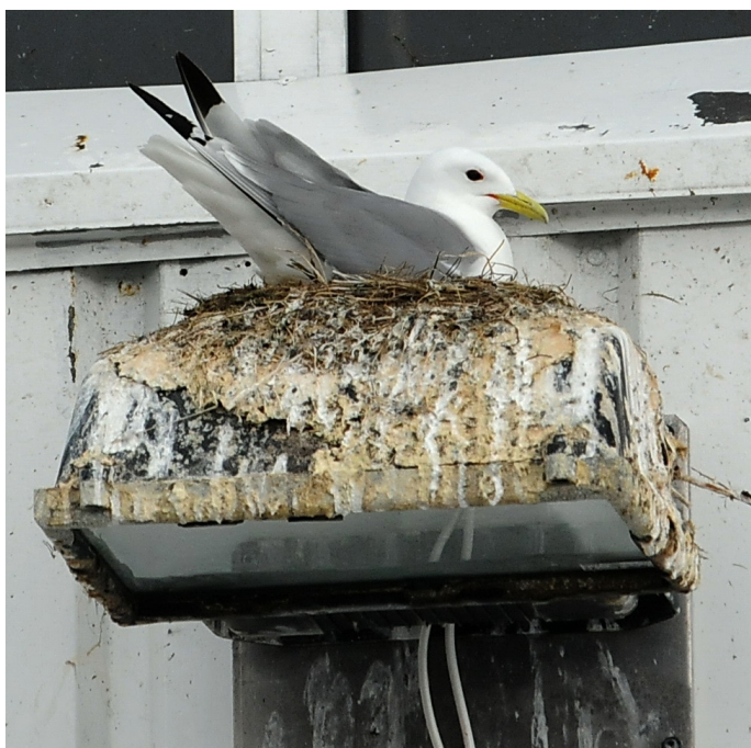
Krykkje hekker på utelampe