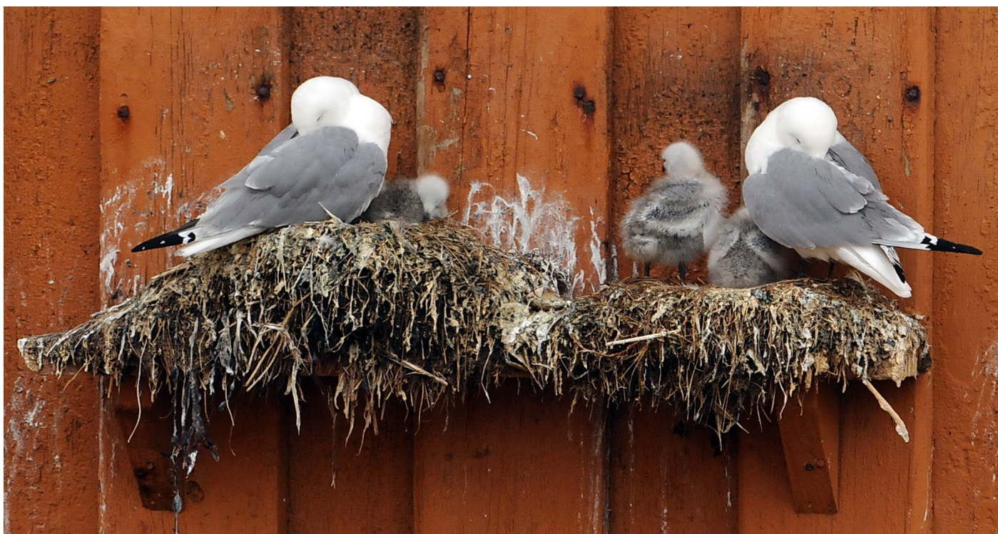
To krykkjepar med unger på en reirhylle på Brodkorbhuset (Vardø)