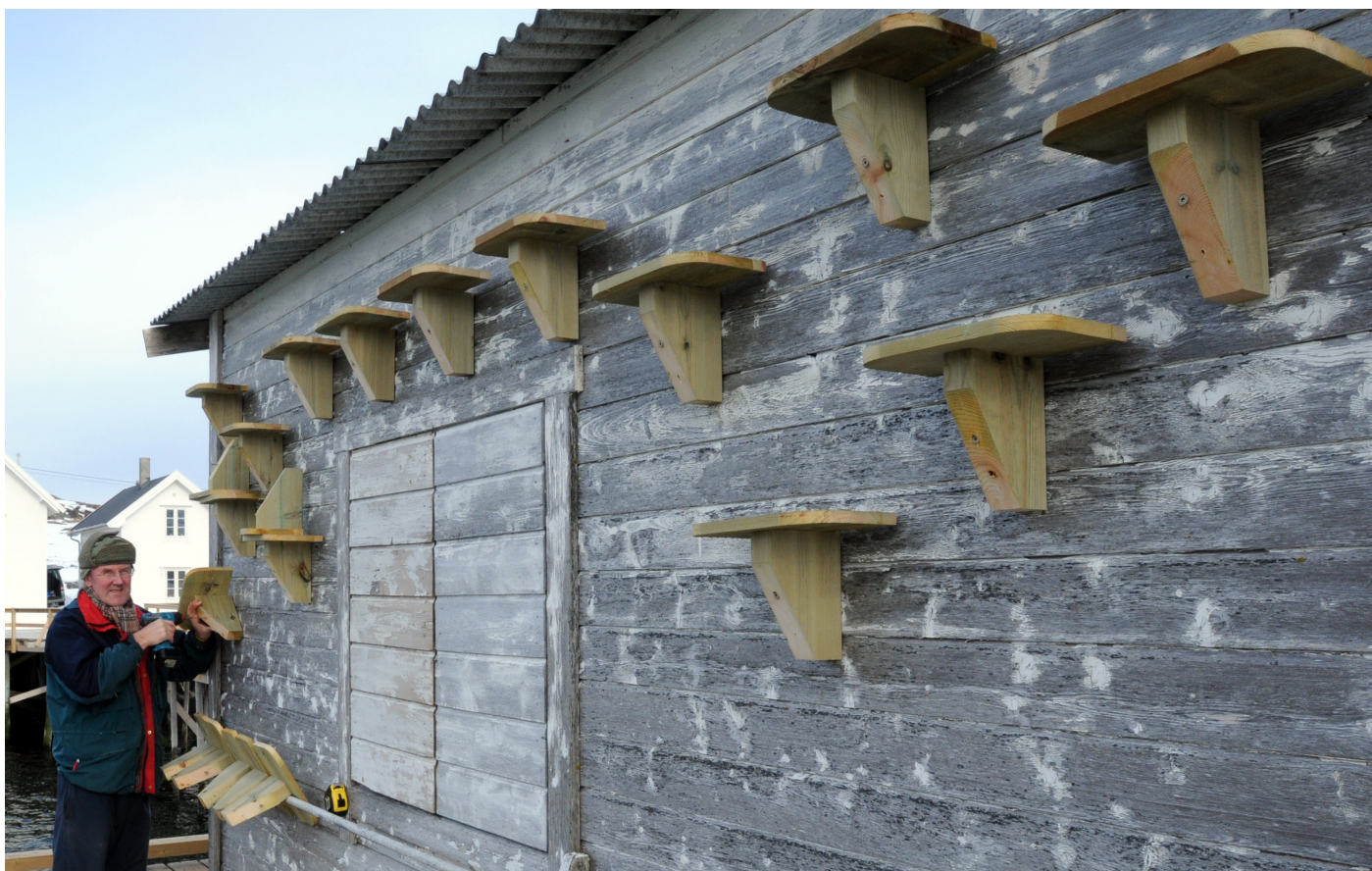
Ny kunstig krykkjekoloni i Kongsfjord som ble satt opp i 2012