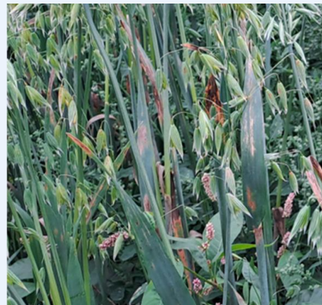
Symptomer på Havrebladflekk