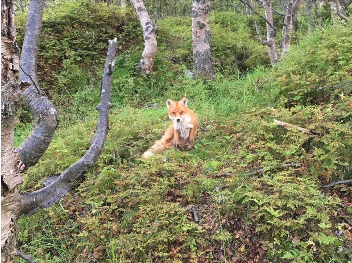
Figur 5: Rødreven – en tilpasningsdyktig luring som også kan ha lam på menyen.