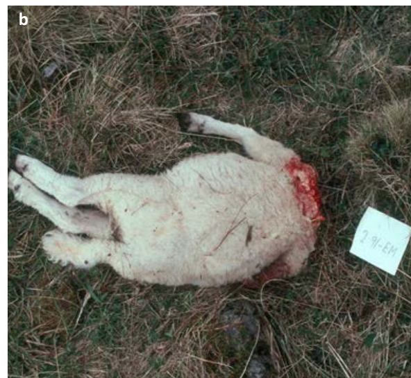
Figur 3: Bildene viser revedrepte lam med klassiske bitt og bloduttredelser i halsregionen (a) og avspist hode (b).