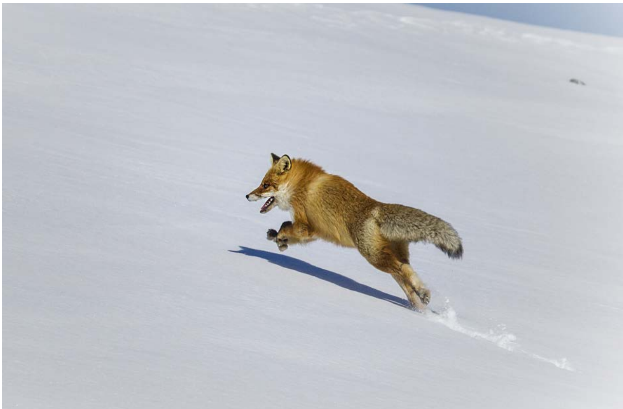
Figur 4: Rødreven har også etablert seg i fjellandskapet (foto: Emil Halvorsrud).

Rødrevbestanden er imidlertid vanskelig å kontrollere gjennom jakt (Hewson 1986) fordi reven har høy reproduksjonsevne, stor tilpasningsevne til habitat og diett, samtidig som dens sosiale organisering tilsier at ledige revirer fort vil kunne bli erstattet av andre rever (såkalt kompensatorisk innvandring). Helt konkret kan avskyting av revirhevdende rever føre til økt immigrasjon av streifende individer og dermed økt lokal revetetthet etter avsluttet jakt (Lieury m.fl. 2015). For å holde en bestand av rødrev nede, er en avhengig av effektiv bestandskontroll og ingen immigrasjon fra omkringliggende områder, noe som er lite sannsynlig å oppnå uten betydelig innsats. Jakt på rev har sannsynligvis større effekt om vinteren enn